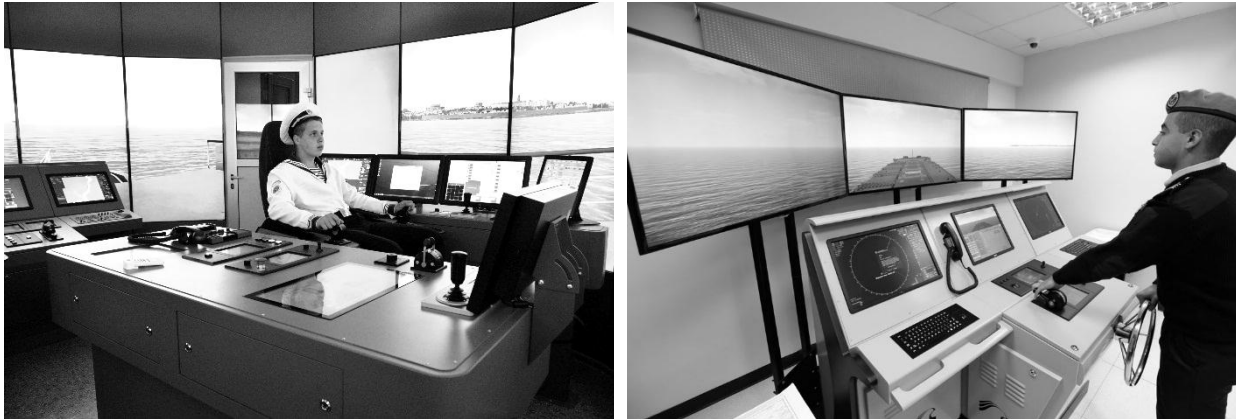
Рисунок 2 – Види конфігурацій і розташування інформаційних інтерфейсів Зовнішній опис інформаційного інтерфейсу можна представити коротжем: